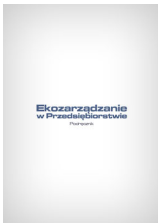
Ekozarządzanie w przedsiębiorstwie - podręcznik