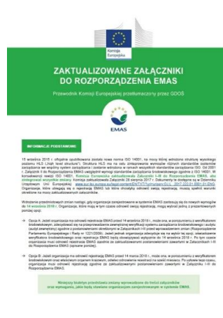
Przewodnik Komisji Europejskiej - zaktualizowane Załączniki do Rozporządzenia EMAS