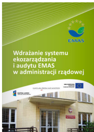
Wdrażanie systemu ekozarządzania i audytu EMAS w administracji rządowej