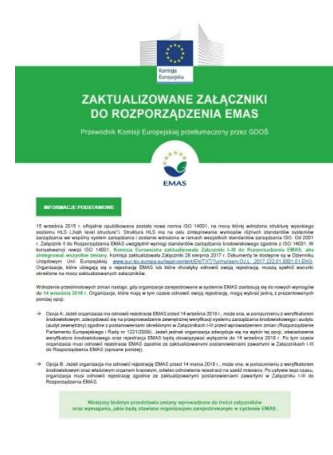
Przewodnik Komisji Europejskiej - zaktualizowane Załączniki do Rozporządzenia EMAS