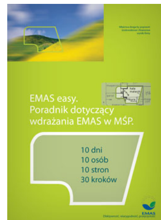
EMAS easy. Poradnik dotyczący wdrażania EMAS w MSP.