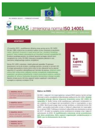
Przewodnik "EMAS i zmieniona norma ISO 14001"