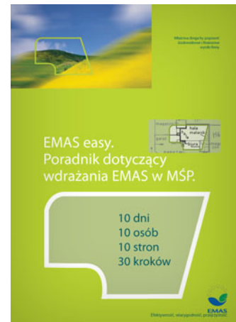
EMAS easy. Poradnik dotyczący wdrażania EMAS w MSP.