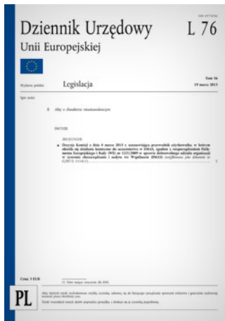
Przewodnik Komisji Europejskiej, w którym określa się działania konieczne do uczestnictwa w EMAS