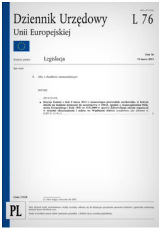
Przewodnik Komisji Europejskiej, w którym określa się działania konieczne do uczestnictwa w EMAS