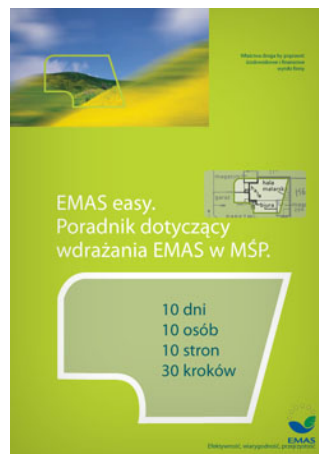
EMAS easy. Poradnik dotyczący wdrażania EMAS w MSP.