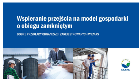
Wspieranie przejścia na model gospodarki o obiegu zamkniętym