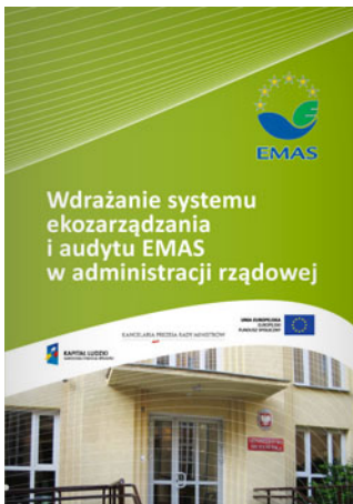
Wdrażanie systemu ekzarządzania i audytu EMAS w administracji rządowej