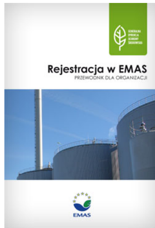
Broszura informacyjna - Rejestracja w EMAS