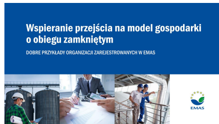
Wspieranie przejścia na model gospodarki o obiegu zamkniętym