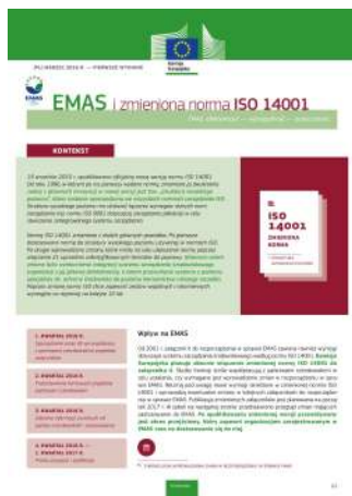
Przewodnik "EMAS i zmieniona norma ISO 14001"