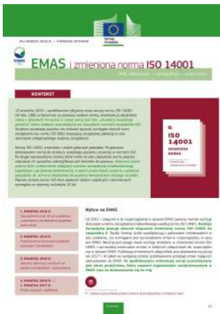
Przewodnik "EMAS i zmieniona norma ISO 14001"