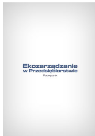
Ekozarządzanie w przedsiębiorstwie - podręcznik