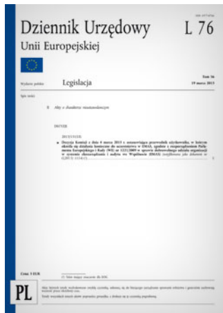
Przewodnik Komisji Europejskiej, w którym określa się działania konieczne do uczestnictwa w EMAS