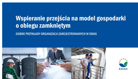
Wspieranie przejścia na model gospodarki o obiegu zamkniętym