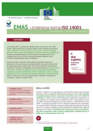
Przewodnik "EMAS i zmieniona norma ISO 1400"