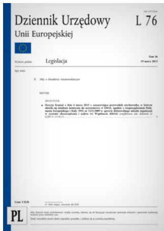
Przewodnik Komisji Europejskiej, w którym określa się działania konieczne do uczestnictwa w EMAS