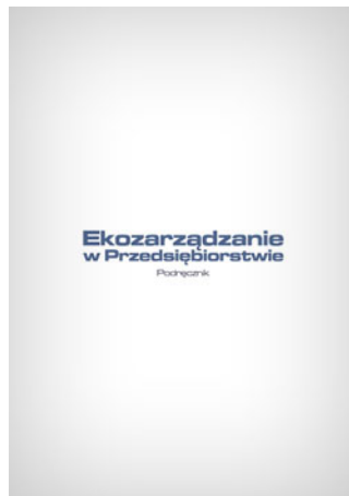
Ekozarządzanie w przedsiębiorstwie - podręcznik