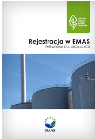
Broszura informacyjna - Rejestracja w EMAS