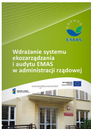
Wdrażanie systemu ekozarządzania i audytu EMAS w administracji rządowej